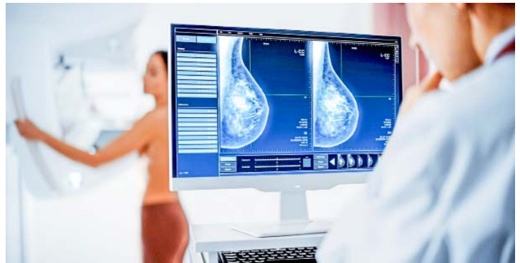
Frauen von 50 bis 75 Jahren haben Anspruch auf eine Mammografie, die Knoten zeigt, bevor man sie ertasten kann

► Ja, etwa zu Wechseljahresbeschwerden, zum Teil auch Knochensteifigkeit. Aber die Therapie ist